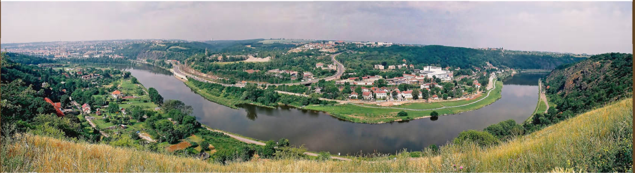
Pohled z ostrožny na vinoucí se Vltavu.

Místo, na kterém se právě nacházíte, je významnou pražskou archeologickou lokalitou s doklady osídlení z různých období pravěku. Pozemek, který se místně nazývá „Na Farkách“ nebo také „Větrník“, či „Nad Podhořím“, byl ještě počátkem 20. století intenzivně zemědělsky obděláván – pole se zde nacházelo až do roku 1970, kdy se začalo stavět sídliště Bohnice. Na severovýchodě k němu přiléhá prostor bývalé cihelny, místně zvané podle posledních majitelů „U Osbornů“. V ní se ještě počátkem dvacátého století těžila cihlářská hlína.