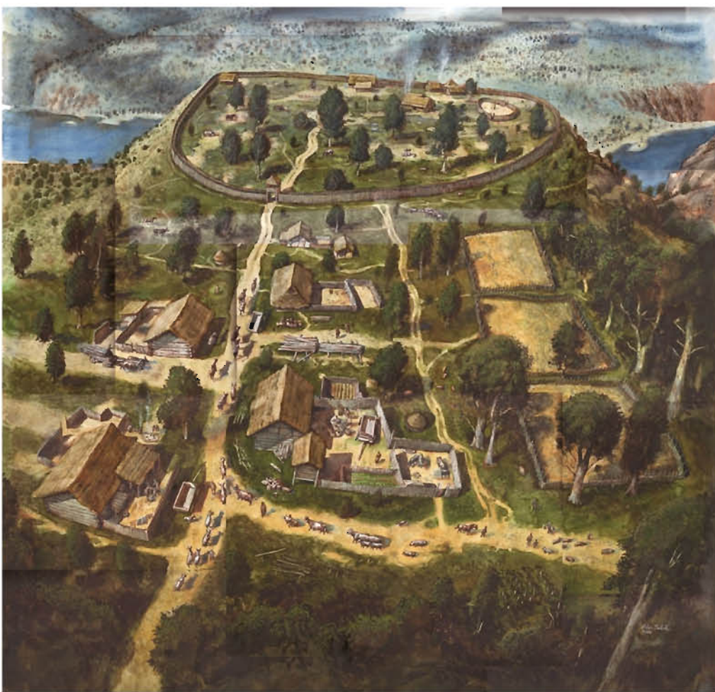
Rekonstrukce pravěkého osídlení lokality Na Farkách. Autor Libor Balák

Místo, na kterém se právě nacházíte, je významnou pražskou archeologickou lokalitou s doklady osídlení z různých období pravěku. Pozemek, který se místně nazývá „Na Farkách“ nebo také „Větrník“, či „Nad Podhořím“, byl ještě počátkem 20. století intenzivně zemědělsky obděláván – pole se zde nacházelo až do roku 1970, kdy se začalo stavět sídliště Bohnice. Na severovýchodě k němu přiléhá prostor bývalé cihelny, místně zvané podle posledních majitelů „U Osbornů“. V ní se ještě počátkem dvacátého století těžila cihlářská hlína.