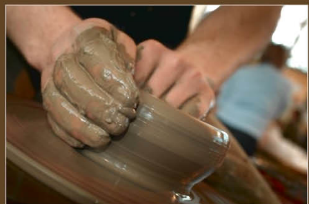
Točení nádoby na hrnčířském kruhu