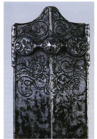
Horní část železné pochvy meče zdobená složitým gravírovaným ornamentem. Doba laténská (2. stol. př. n. l.), La-Tène (Švýcarsko).

Výroba železa z rudy byla náročným procesem. Hlavním důvodem je vysoký bod tání železa (1535°C), kterého nebylo možno technologiemi, jež lidé v pravěku znali, dosáhnout. Nejprve bylo nutné železnou rudu roztřídit, rozdrtit a upravit pražením v mělkých jamách. Potom hutníci vsazovali rudu do železářských pecí, ve kterých se za vysokých teplot (kolem 1400°C) oddělila většina neželezných součástí rudy (hutnická struska). Po skončení tavby byl z pece vyjmut polotovar – železná houba – kterou lidé dále zpracovávali ve vyhřívacích výhních. Zde se opakovaným prokováváním z nahřáté houby odstraňovaly zbytky strusky. Výsledkem byly železné nebo ocelové lupy. Kvalita železa se značně lišila v závislosti na zkušenostech řemeslníků. Hutnění vyžadovalo značné množství dřevěného uhlí, které se získávalo milířováním. Některé hutnické dílny překovávaly lupy do tvarově jednotných ingotů (hřiven), které sloužili k vývozu a často měly funkci předmincovních platidel.