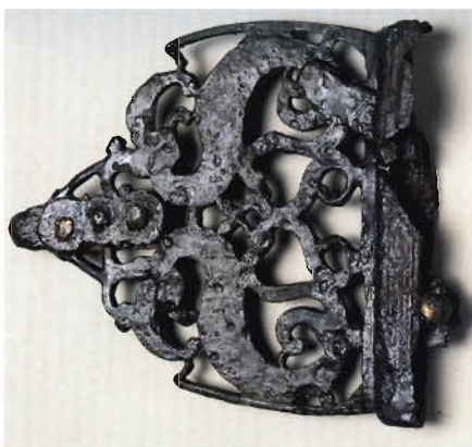
Ozdoba opasku zhotovená z prolamovaného železného plechu. Časná doba laténská (2. pol. 5. stol. př. n. l.), Roseldorf (Rakousko).