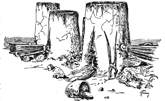
Rekonstrukce hutnické dílny vybavené šachtovými pecemi se zahloubenou nístějí (doba římská, Tuchlovice).

Železo je sice druhým nejhojnějším kovem na zemi (po hliníku), ale vyskytuje se téměř výhradně jako příměs hornin či minerálů – železných rud. Nejdříve začali lidé zpracovávat meteorické železo. Vzhledem k vzácnosti a nevhodnosti k výrobě nástrojů bylo využíváno spíše pro svůj symbolický význam – jako zhmotněné poselství z nebes. Ze železných rud zpracovávali lidé v pravěku magnetovec, krevle a nejčastěji málo kvalitní, ale nejdostupnější bahenní rudy (hnědele neboli limonity). Ty se nacházely v dostatečném množství v každém regionu. Proto, když lidé pronikli do tajů výroby železa, nebyli závislí na jeho dovozu z velkých vzdáleností. Železné rudy lidé po dlouhou dobu získávali sběrem či povrchovou těžbou.